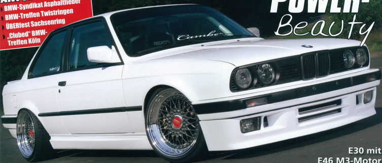
E30 mit E46 M3-Motor