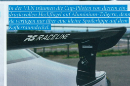
In der VLN nahmen die Cup-Piloten vor diesem ein druckstabilen Heckflügel auf Aluminium-Trägern, denn sie verfügen nur über eine kleine Spoilerlippe auf dem Kohlefaserdeckel.