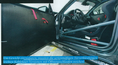
Im Gewicht eingespart, mussten die serienmäßigen Türverkleidungen leichten Kohlefaser-Versionen mit Öffnungsschlaufen weichen.