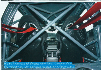
Wie im Rennsport: Schalensitze mit 6-Punkt-Gurten und ein Oberkantung mit allen wichtigen Kreuzen sowie Flankenschutz.